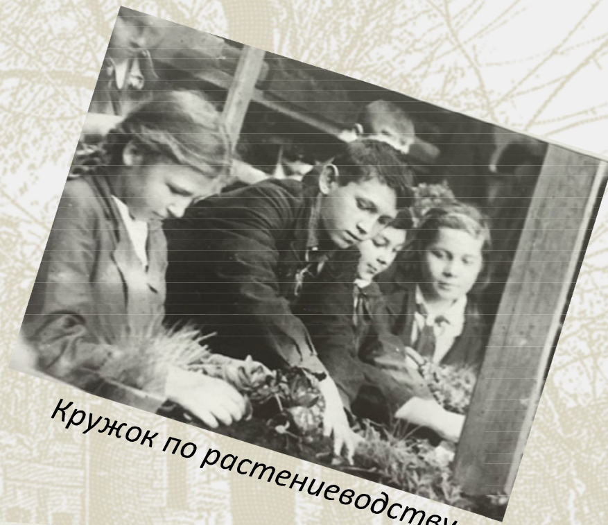
Кружок по растениеводству