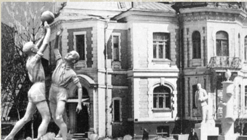
скульптуры в саду Дома пионеров

На территории парка был сад с плодовыми деревьями, небольшой зоопарк, бассейн, в котором жили рыбки. Здесь были обустроены зоны отдыха с уютными скамейками, но главным местом парка был Зеленый театр с амфитеатром на 800 мест.