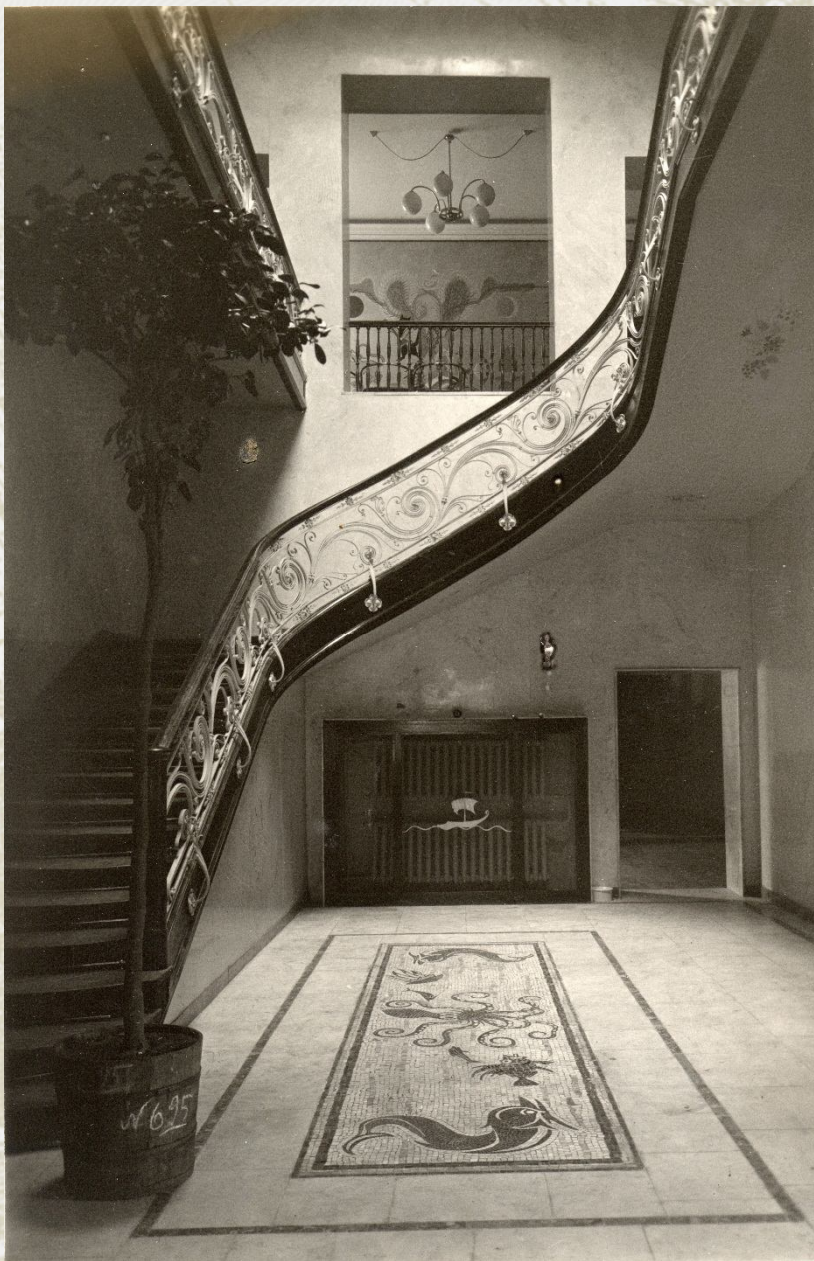
Мозаика на полу и сама лестница за 80 лет прекрасно сохранились, не правда ли?