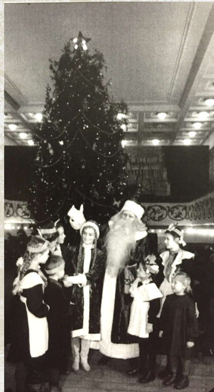
А вот роспись балкона в зале, к сожалению, до наших дней не дожидка.