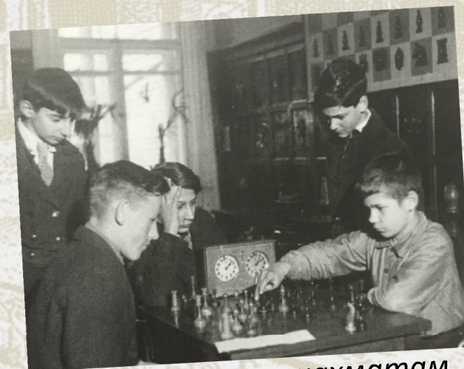
Кружок по шахматам