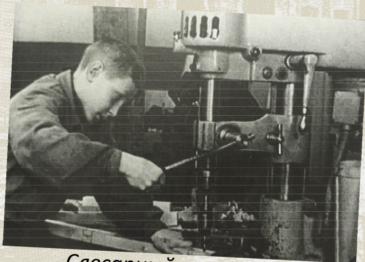
Слесарный кружок. Во время войны работал для фронта.