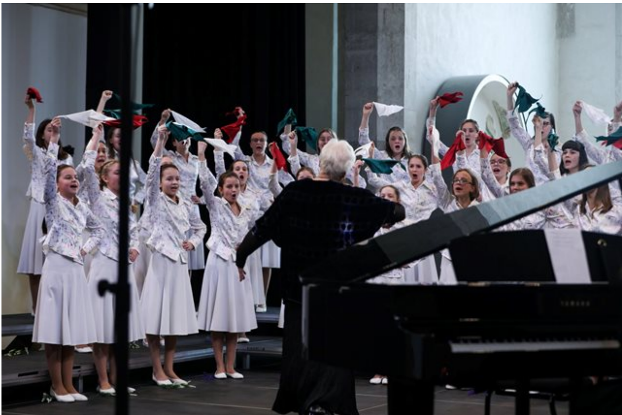
Stalna repertoarja ruskega otroškega zbora je med drugim ljudska glasba

Spletna stran uporablja piškotke. S tem vam želimo omogočiti boljše uporabniško izkušnjo na naši spletni strani. Strinjam se o piškotkih >>