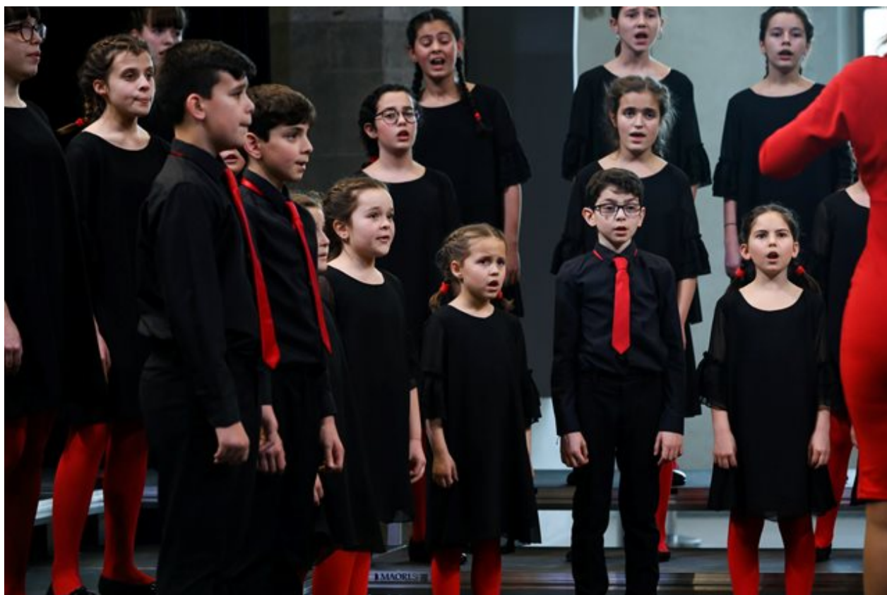
Coro Los Peques del León de Oro